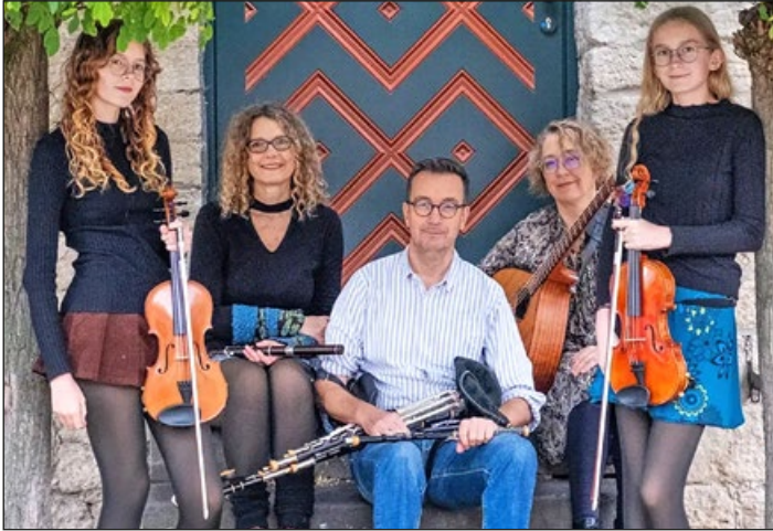
Die Band Taila

(r) Die Celtic-Folk-Band Taila gibt am 12. Juni um 19.30 Uhr ein sommerliches Konzert in der Katharina-von-Bora-Kirche in Itzum, St.-Georg-Straße 11. Die Höhe des Eintritts ist frei wählbar! Der Hut für die Band geht herum! Einlass, Snacks und Getränke – gegen Spende fürs Haus – ab 18.30 Uhr!