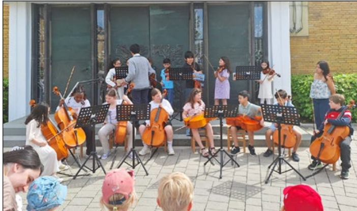
Gleich geht es los, und es singt und klingt auf den Kirchenstufen am 3. Mai

(bc) Am 3. Mai veranstaltete der Arbeitskreis „Bewahrung der Schöpfung“ der Itzumer Kolpingfamilien gemeinsam mit dem Verein „Arpeggio e.V. Hildesheim“ einen Pflanzenmarkt auf dem Platz vor der Kirche, anschließend konnten die Besucher und Besucherinnen ein Streichkonzert vor dem großen Kirchenportal erleben.