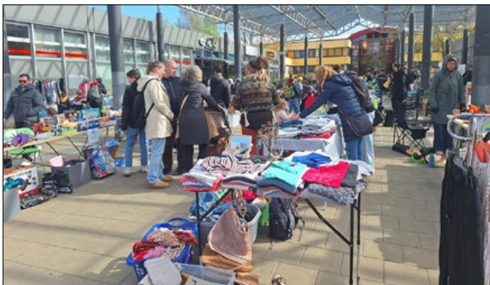
Stöbern, treffen, klönen auf dem großen Flohmarkt

(bc) Wenn sich auf dem großen Platz im Einkaufszentrum auf der Marienburger Höhe und vor der Universität viele Menschen drängeln, um ein Schnäppchen zu machen - dann ist Flohmarkt!