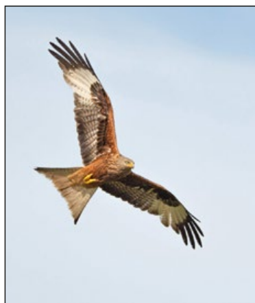
Ein Rotmilan im Flug

Ab Mitte April sind alle Reviere besetzt und die Horste gebaut. Die meisten Paare legen ihre Eier (meistens 2–3, manchmal 4) zwischen Ende März und Anfang Mai. Die Jungen schlüpfen nach 5–6 Wochen, die Nestlingsdauer liegt zwischen 45 und 50 Tagen, bei schlechten Nahrungsbedingungen kann es 60–70 Tage dauern. Die Gelege werden von beiden Partnern bebrütet, dabei trägt das